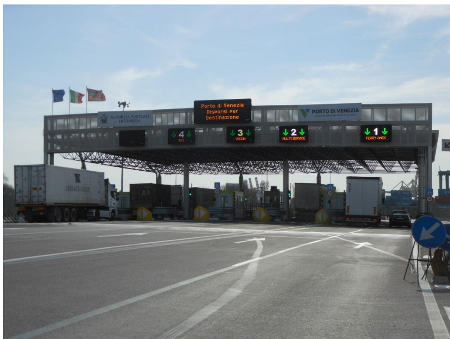
IN CORRISPONDENZA DELLA STRUTTURA VARCO DOGANALE: ALTEZZA = 6,20 m; LARGHEZZA PRESSO LA CORSIA N°1 = 6,40 m