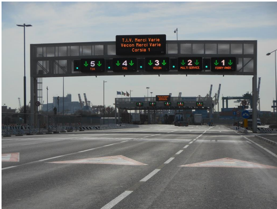
IN CORRISPONDENZA DEL PORTALE "C" DI VIA DELL'AZOTO: ALTEZZA 6,20 m