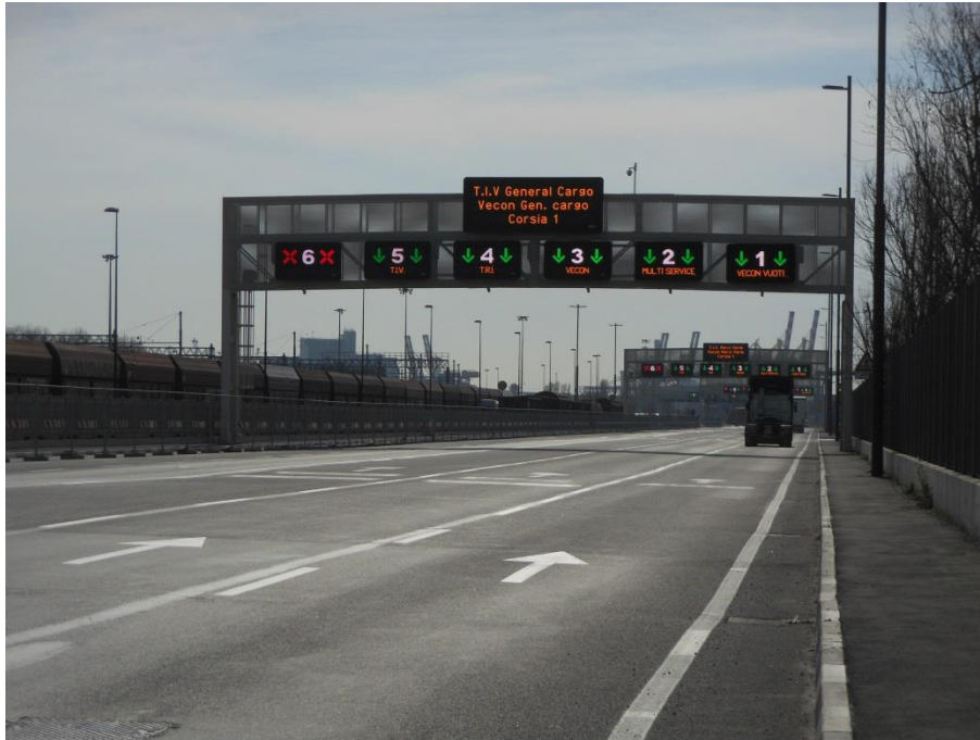
IN CORRISPONDENZA DEL PORTALE "A" DI VIA DELL'AZOTO: ALTEZZA 6,20 m